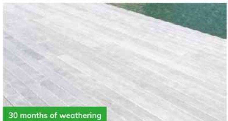
CLADDING PROJECT, NORTH AMERICA